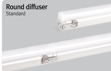
Round diffuser Standard