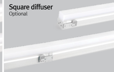
Square diffuser Optional